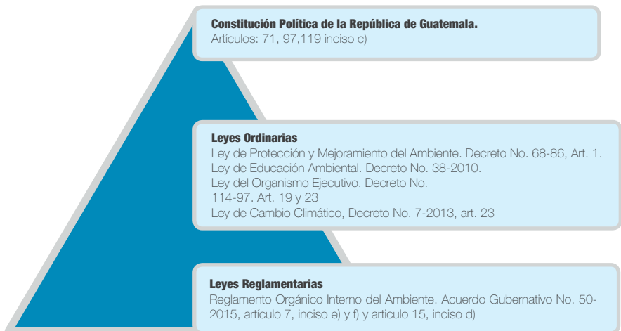
Figura 1. Pirámide Jurídica de la Educación Ambiental en Guatemala